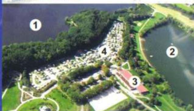
1 Segelsee 2 Ostsee 3 Aqua Riese 4 Campingplatz

Fahrräder und Kanus können Sie natürlich bei uns ausleihen, ab einer Gruppe von zehn Personen bieten wir auch organisierte Touren an.